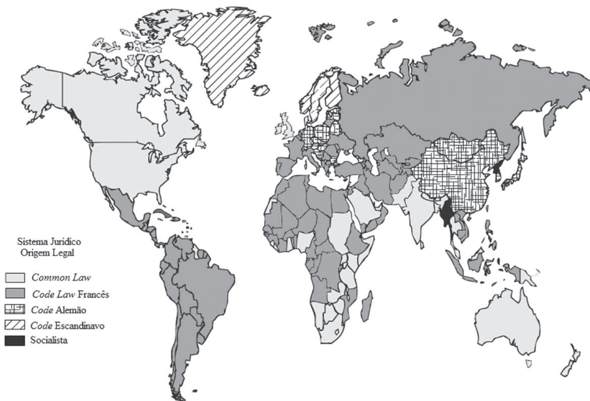
Figura 1. O sistema jurídico dos países

nível de proteção aos acionistas, destacando-se o controle exercido por grupos familiares ou pelo Estado.